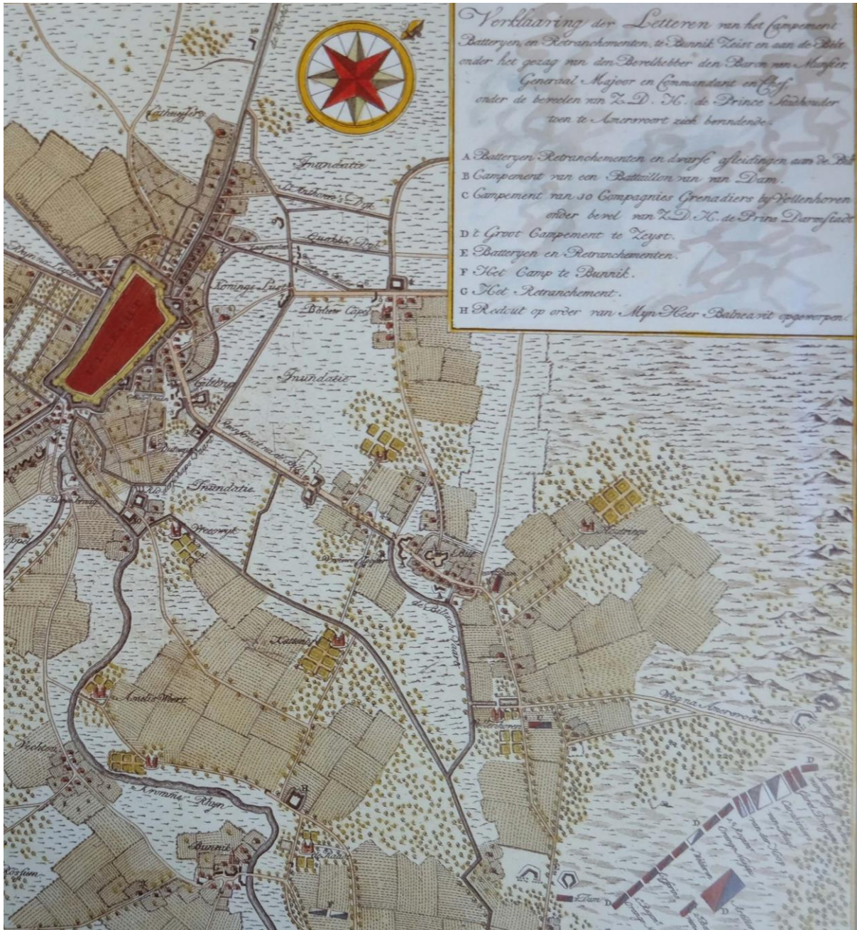
Situatietekening van de militaire situatie bij De Bilt in 1787 t.t.v. de Pruisische inval. Detail van een kaart uit 1787, Nationaal Archief 4 VTHR, inventaris 4644