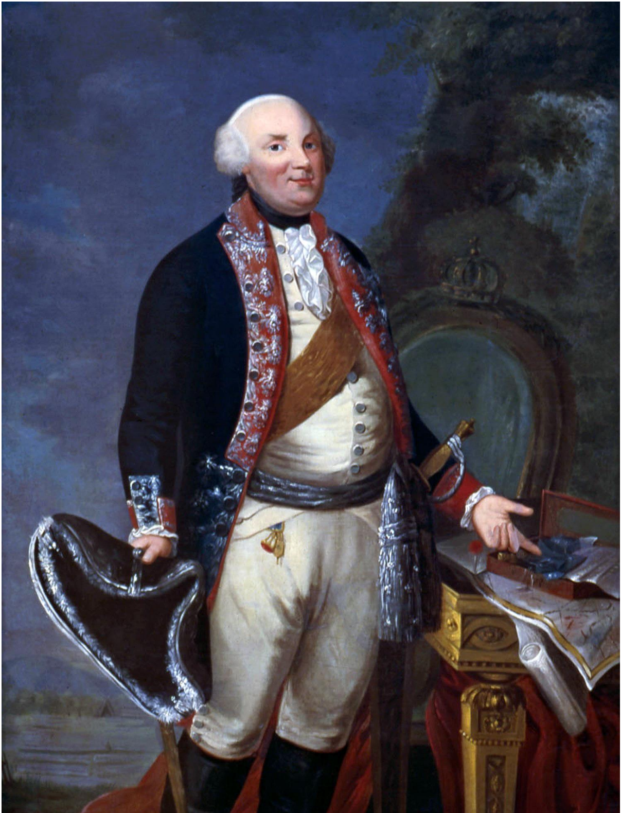
W. Faber, Friedrich Wilhelm II, 1789. ‚Inventar Burg Altena‘.

Overijssel, (gebieden waar de patriotten de overhand hadden) werden in staat van verdediging gebracht. In Utrecht stonden de patriotse troepen onder leiding van de een politieke avonturier, de Rijngraaf Frederik III van Salm-Kyrbourg.