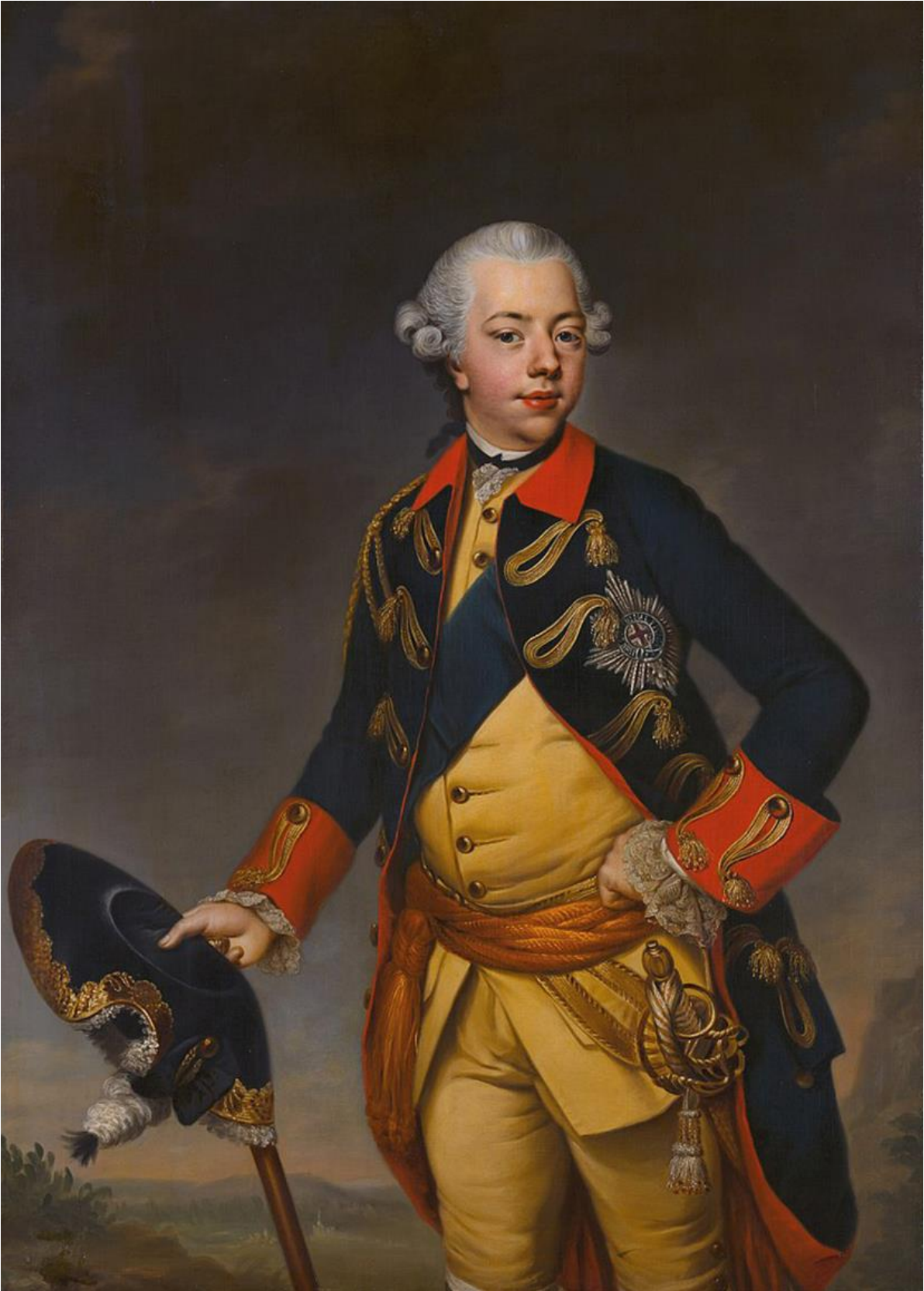
Stadhouder Willem V. Johann Georg Zisenis, Mauritshuis.

Da des Königs von Preußen Majestät, ungeachtet wiederholentlicher Anfragen, keine Satisfaction über die Ihnen angethane Beleidigung, wegen der Gefangennehmung Sr. Majestät