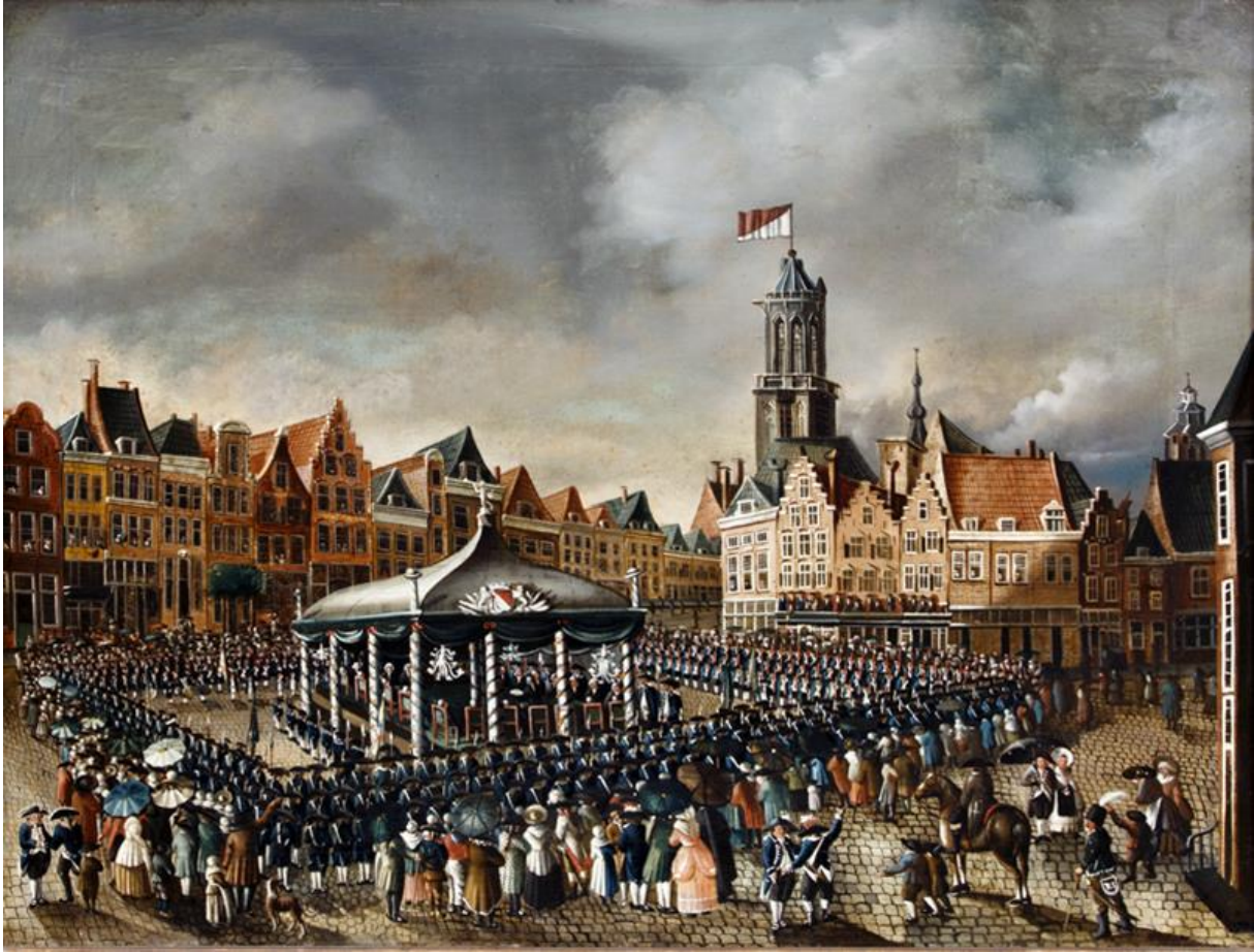
Eedsaflegging op het regeringsreglement op de Neude te Utrecht op 12 oktober 1786. Centraal Museum

In feite was daar echter geen sprake van, maar de prinses probeerde op deze manier haar broer Frederik Willem tot ingrijpen te bewegen. De Hollandse Staten besloten uiteindelijk dat Wilhelmina weer terug moest keren naar Nijmegen. Waarschijnlijk ontving Frederik Willem het bericht van Wilhelmina's 'gevangenneming' per koerier op 27 juni 1787. Hoe het zij, op 30 juni was Wilhelmina weer terug in Nijmegen.