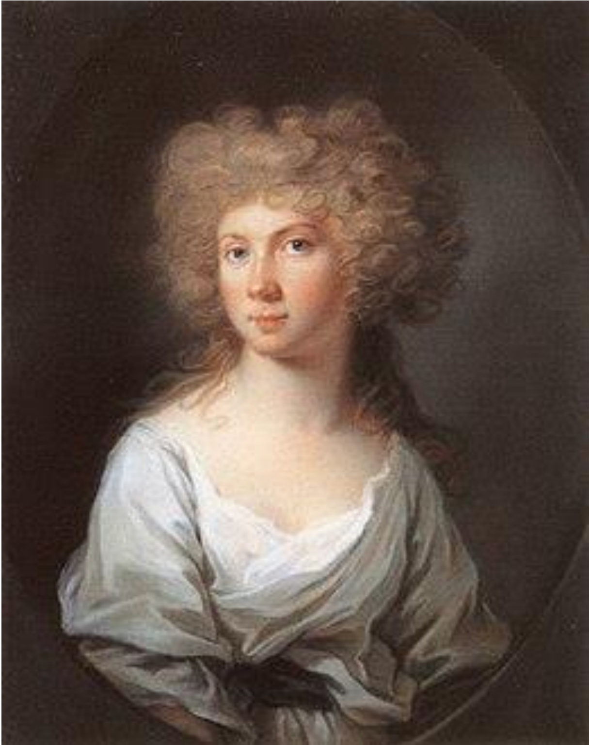
Wilhelmina van Pruisen omstreeks 1795.