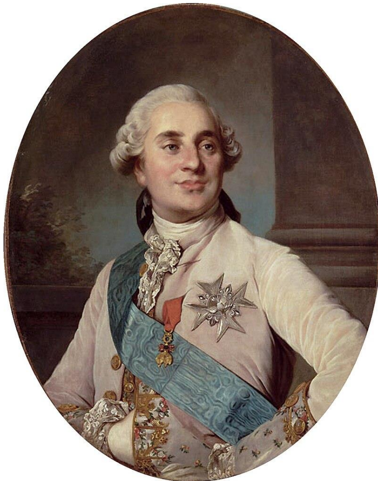
Joseph-Siffred Duplessis. Lodewijk XVI, paleis Versailles.

[Zijne Majesteit, de koning van Pruisen, kreeg, ondanks herhaalde verzoeken, geen voldoening voor de belediging van de kant van de Staten van Holland, te weten de arrestatie van Zijner Majesteits zuster, de prinses van Oranje, op haar reis naar Den Haag haar aangedaan. Daarom heeft dezelve Allerhoogste Majesteit [Frederik Willem] besloten om met een korps troepen van 25 bataljons en 25 eskadrons op te trekken en zelf de eerherstel het gewest Holland te gaan halen.]